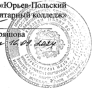
ГРАФИК УЧЕБНОГО ПРОЦЕССА 4-НК группа 2024 – 2025 учебный год Специальность 44.02.02 Преподавание в начальных классах